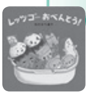
レッツゴーおべんとう! わたなべあや 白泉社