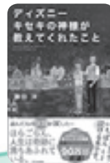
ディズニーキセキの神様が教えてくれたこと 鎌田 洋 SBクリエイティブ