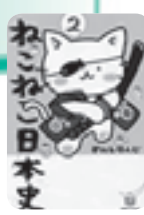
ねこねこ日本史〈2〉 そにしけんじ 実業之日本社