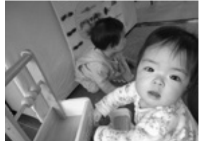
どうやってあそぶのかな?