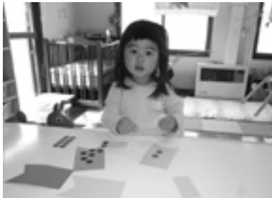
こいのぼりできた～!