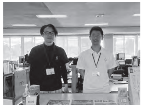
真狩村章入りポロシャツを着用しています

服装と脱炭素、あまり関係のないように思えますが、「クールビズ」は浸透しているのではないのでしょうか。過度な冷房に頼らない気温に合わせた柔軟なスタイルのことで、職場でのノーネクタイ、ポロシャツ着用などもクールビズのスタイルです。役場職員もこの期間は軽装執務を実施しています。