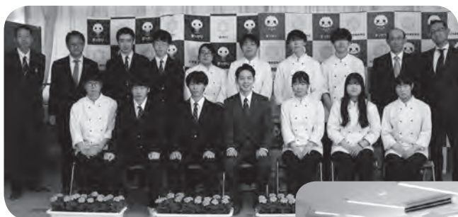
3年生とスイーツ作りを体験